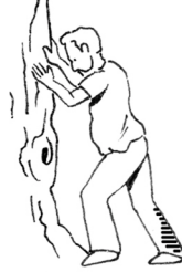
Korte lægmuskel Bøj lidt i knæet